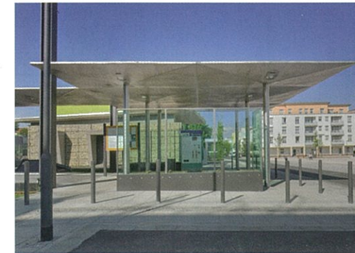
Bauwerk nach Fertigstellung © Syra_Schoyerer Architekten BDA