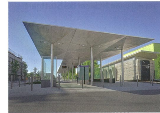
Kopfbahnhof mit Mittelbahnsteig © Syra_Schoyerer Architekten BDA