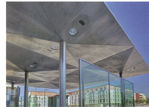
Witterungsschutz im Wartebereich