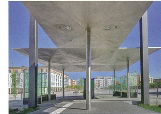
Auskragende Dachfläche © Syra_Schoyerer Architekten BDA