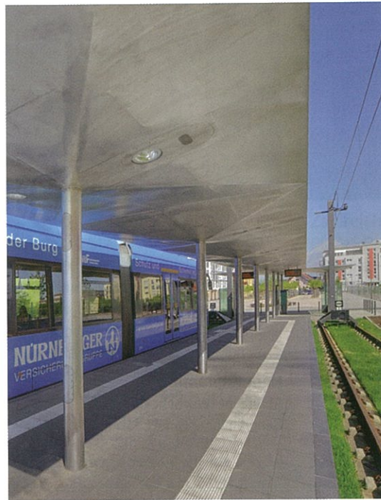
Interessantes Edelstahldach © Syra_Schoyerer Architekten BDA

Als große T-förmige Fläche weitet sich dementsprechend das Dach des Mittelbahnsteiges über dem Wartebereich am Gravensteiner Platz deutlich auf. Das Edelstahldach besteht aus 12 umgekehrten flachen Pyramidenformen, welche auf Edelstahlrundstützen ruhen. Durch die bündig in die mattglänzende Dachfläche integrierten Strahler und Lautsprecher und durch die