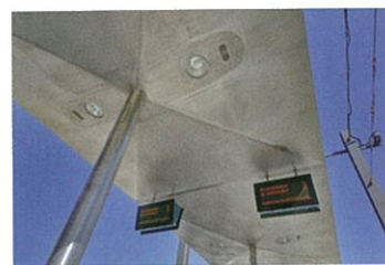
Stahlelemente auf Stützen © Syra_Schoyerer Architekten BDA

T-Form entsteht unterseitig die Anmutung eines Flugobjektes. Oberseitig erinnert die gitterrostabgedeckte T-förmige Dachfläche an einen Flugzeugträger.