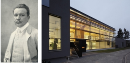
Joseph-Maria Olbrich / Fachbereich Gestaltung Hochschule Darmstadt